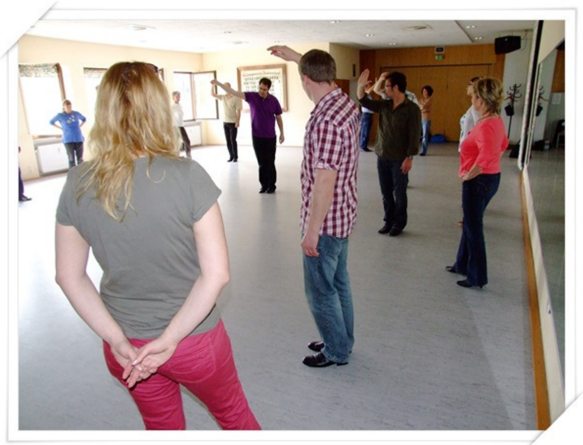
... Dame einfangen,...