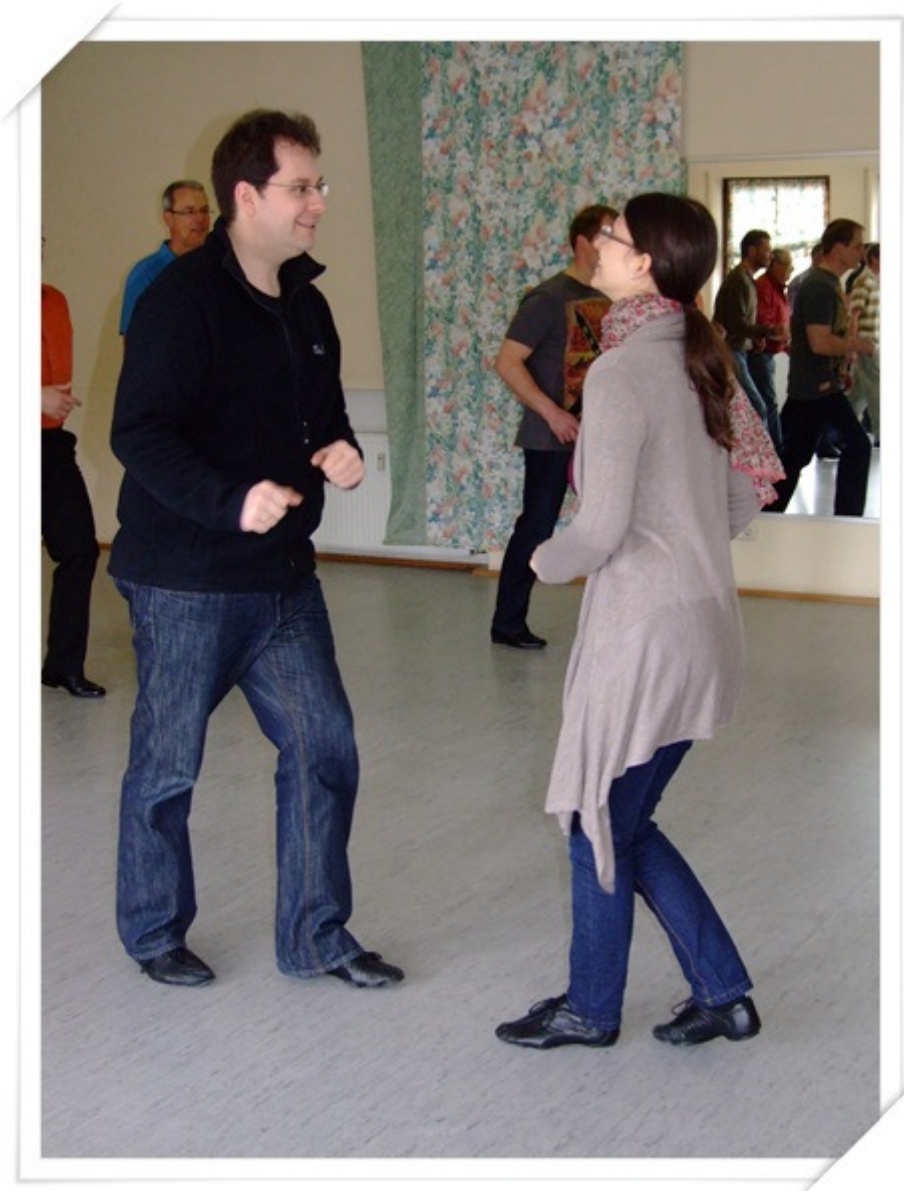
Die beiden können diese Tänze nicht nur hervorragend tanzen, sie geben ihr Können auch gern an andere weiter.