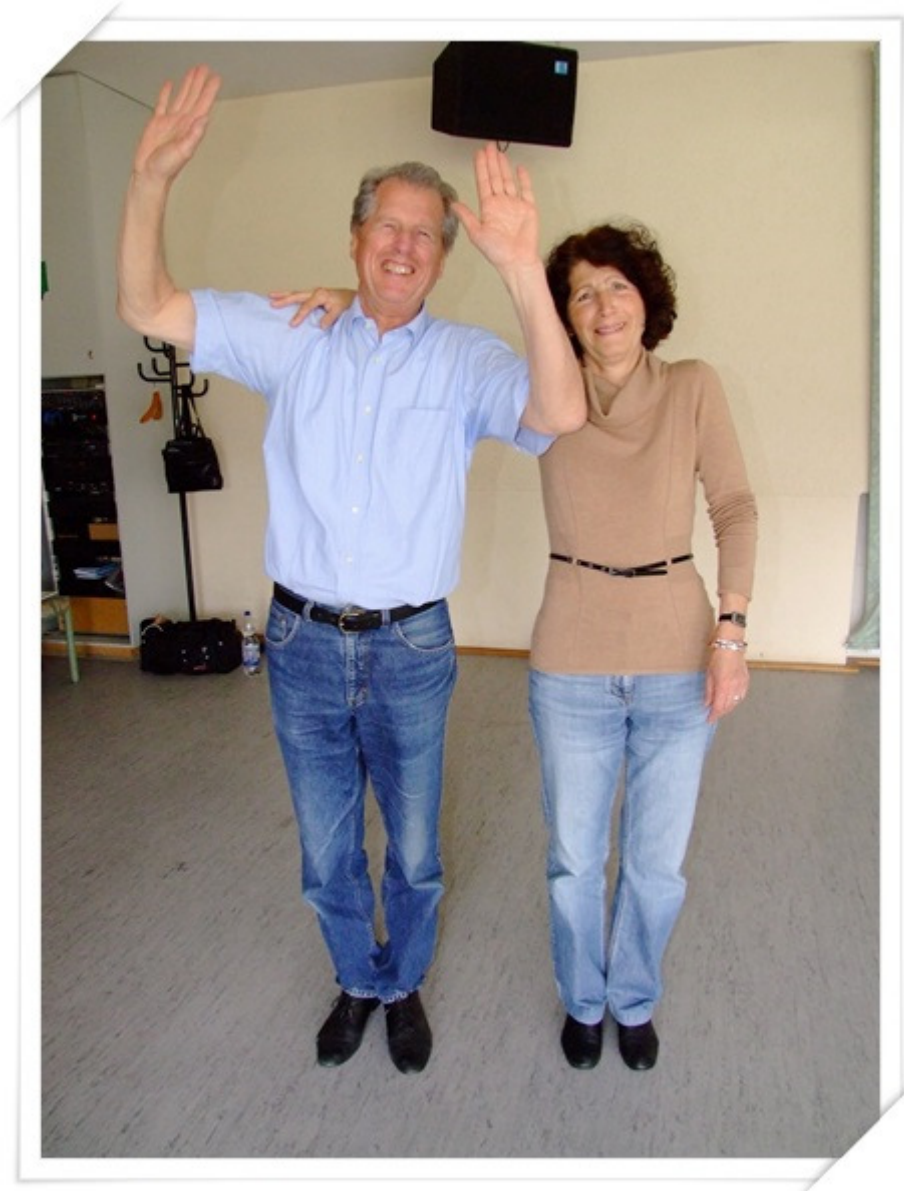
Grundschrift, unter den gefassten Händen drehen, ...